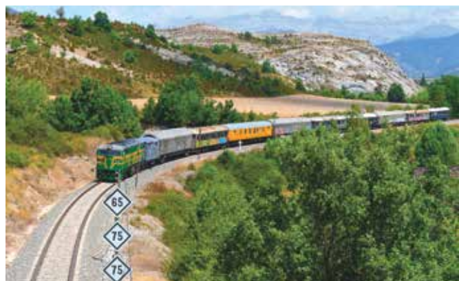
Le convoi quitte la gare de Sabiñanigo en direction d'Ayerbe

Douze voitures et fourgons qui ont passé un examen technique approprié dans un atelier homologué et disposent de l'autorisation de transport spécial délivrée par l'ADIF, sont ainsi descendus vers Saragosse par voie ferrée, encadrées par certains éléments du « Train Bleu » de l'AZAFT, déjà restaurés, qui les accompagnaient pour assurer le