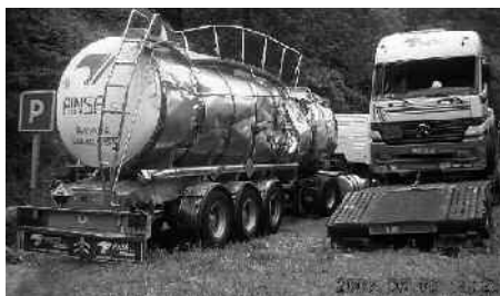
Juin 2007, simple incident...

Il lui rappelle que les quatre priorités pour l'Aquitaine sont : — la modernisation des lignes ferroviaires d'aménagement du territoire ; — le lancement d'une autoroute ferroviaire sur le corridor atlantique ; — la réalisation de la ligne à grande vitesse Sud-Europe-Atlantique ; — la réouverture de la ligne Pau-Canfranc-Saragosse.