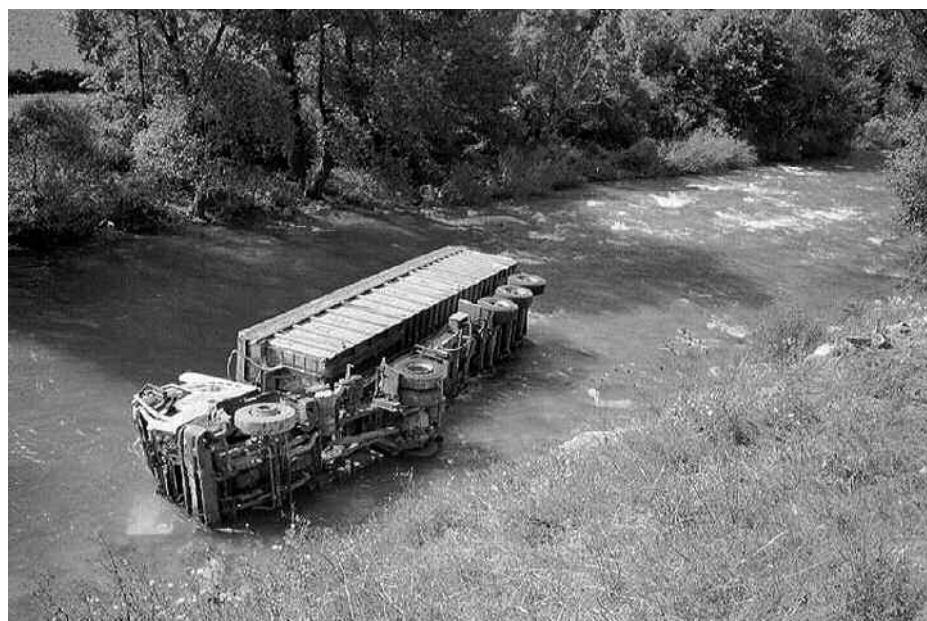
Photo prise en 2003 par Gilbert Gégoue, cette fois encore on disait « plus de peur que de mal ».