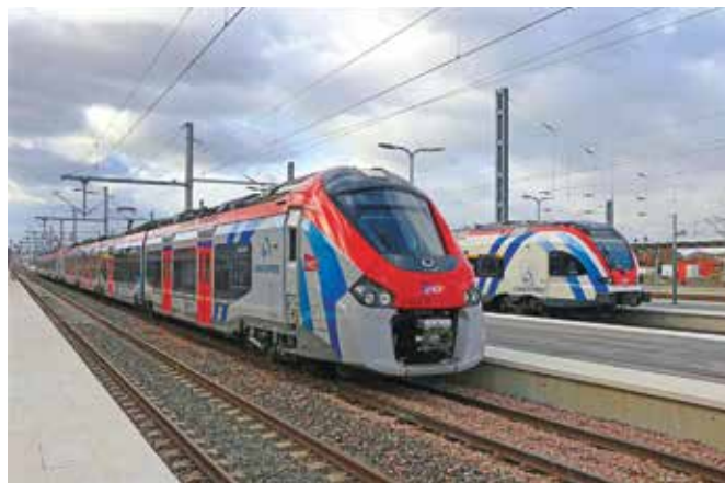
En gare d'Annemasse en février 2020 : deux automotrices arborant la même livrée du Léman Express, une Régiolis de la SNCF et une Flirt des CFF.