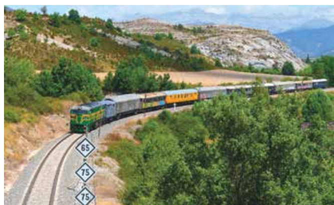
Le convoi quitte la gare de Sabiñanigo en direction d'Ayerbe

Douze voitures et fourgons qui ont passé un examen technique approprié dans un atelier homologué et disposent de l'autorisation de transport spécial délivrée par l'ADIF, sont ainsi descendus vers Saragosse par voie ferrée, encadrées par certains éléments du « Train Bleu » de l'AZAFT, déjà restaurés, qui les accompagnaient pour assurer le